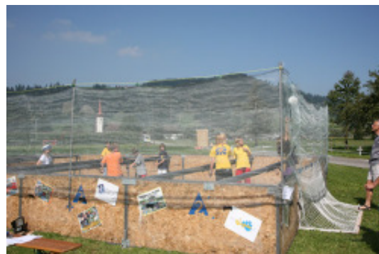
Humankicker (in diesem Töggelkasten sind Menschen die Töggeli...)